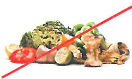
NO Food Waste