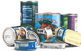
Food & Beverage Cans