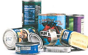
Latas de alimentos y bebidas