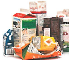
Cartones de alimentos y bebidas