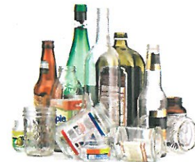
Glass Bottles & Containers