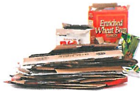
Flattened Cardboard & Paperboard