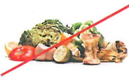
Residuos de comidas