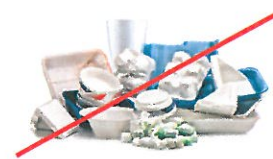
Vasos y contenedores de poliestireno

(Busque un sitio de reciclaje en plasticfilmrecycling.org .)