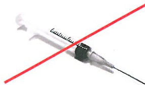
NO Needles (Keep medical waste out of recycling. Place in safe disposal containers like Waste Management's MedWaste Tracker® box.)

To Learn More Visit: RecycleOftenRecycleRight.com