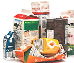
Food & Beverage Cartons