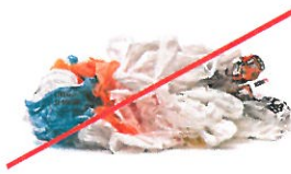
Bolsas y envolturas de plástico

(Busque un sitio de reciclaje en plasticfilmrecycling.org .)