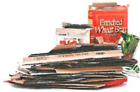
Cartón y cartulina aplastados