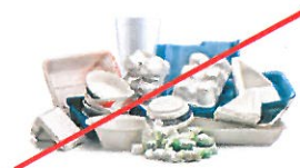
NO Foam Cups & Containers (Check Earth911.org for options.)