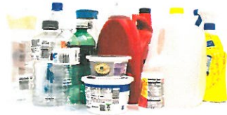
Botellas y envases de plástico