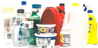
Plastic Bottles & Containers