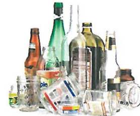
Botellas y frascos de vidrio